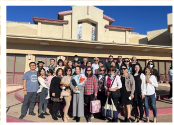
作者(中間持花)受洗後，與團契弟兄姐妹合影

疫情期間，我在家幫女兒帶孩子和做一些家務。日子久了，感覺很無聊，心情憂鬱且脾氣暴躁。女兒就跟我說，媽媽，週末你去教會試試吧！我說去教會我就會好了？女兒說你到教會先去感受一下，說不定哪天你信主了呢！