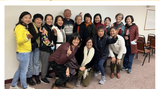
大爹(上圖左四、下圖左五)、大媽(上圖左五、下圖左六), 與團契弟兄姊妹合影